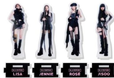
BIG アクリルスタンド (JISOO/JENNIE/ROSE/LISA) 各 2,000 円(税込)