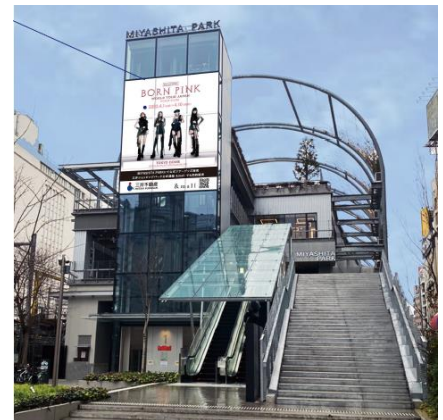
RAYARD MIYASHITA PARK エントランス壁面の大判ポスター(イメージ)