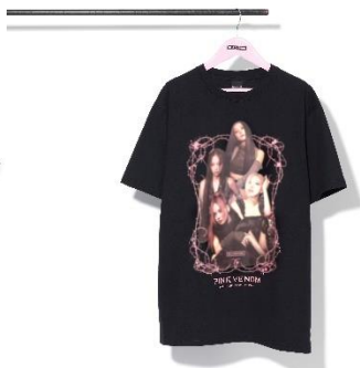
POPUP STORE 限定フォトTシャツ (S/M/L) 各 4,500 円(税込)