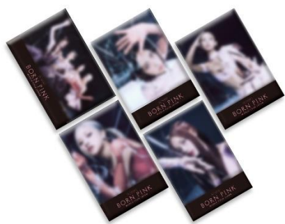
缶バッジ(全5種/ランダム) 各 500 円(税込)