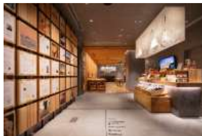
わたくすマーケット&ギャラリー