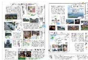
わたす新聞:熊本編