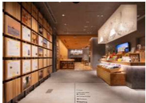
わたす日本橋 内観