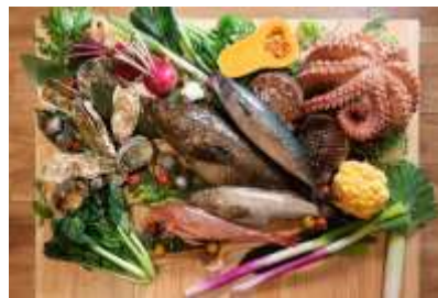
東北の食材イメージ