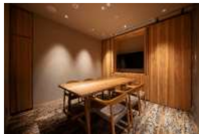
わたすプライベートルーム

最大 12 名で利用できる個室。 落ち着いた空間でゆったりとした時間をお過ごしいただけます。