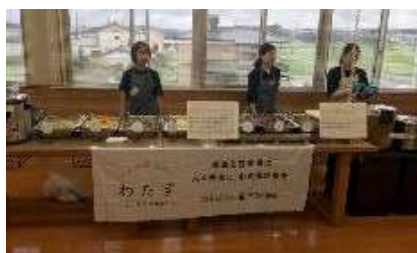
千葉県市原市での炊き出し

被災した地域に赴き、炊き出しなどの活動を行いました。2016年の熊本地震の際には、募金活動や、わたす新聞の発行を通して、現地の情報を発信するような取り組みを行いました。