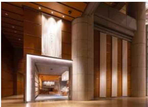
わたす日本橋 外観

当社は2018年よりグループ長期経営方針「VISION 2025」を定め、街づくりを通して持続可能な社会の構築を実現し、様々な社会課題の解決を目指しており、今後もESG経営をさらに加速してまいります。