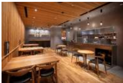
わたすダイニング&バル

10 件以上の東北の生産者と直接契約し食材を仕入れることにより、現地との持続的な関係を構築するとともに、お客様に産直ならではの食の魅力を提供しています。ランチの種類も増え、よりグレードアップしたお食事をお楽しみいただけます。