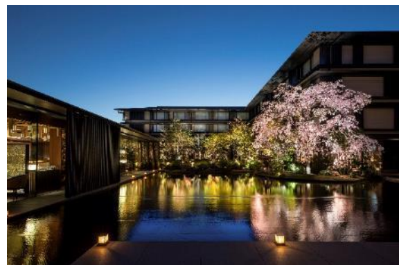
HOTEL THE MITSUI KYOTO(2020年11月開業)