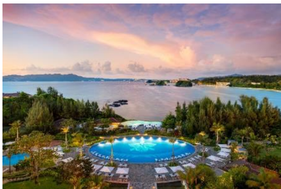
ハレクラニ沖縄(2019年7月開業)