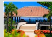
はいむるぶし ホテルレジット