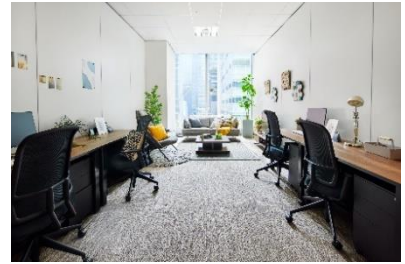
ワークスタイリング FLEX (ワークスタイリング大手町)

※ ワークスタイリング公式ホームページ: https://mf.workstyling.jp/