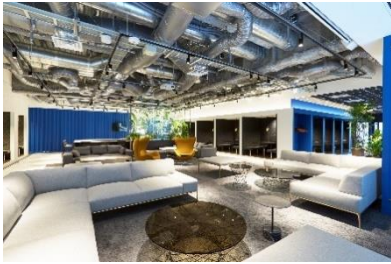
ワークスタイリング SHARE (ワークスタイリング八重洲)

「ワークスタイリング」は 2017 年 4 月より開始した法人会員向けシェアオフィスで、約 900 社、約 24 万人にご契約いただいています(2022 年 11 月 17 日時点)。全国に広がる拠点を 10 分単位で利用可能な法人向け多拠点型サテライトオフィス「ワークスタイリング SHARE」、郊外エリアを中心とした法人向け個室特化型サテライトオフィス「ワークスタイリング SOLO」、多様化する企業のニーズや様々なビジネスシーンに合わせた法人向けフレキシブルサービスオフィス「ワークスタイリング FLEX」を全国 109 拠点で展開しています。三井不動産グループで提供する「ザ セレステインホテルズ」「三井ガーデンホテルズ」「sequence」「東京ドームホテル」の提携 40 拠点と併せて、2022 年 11 月 17 日時点で 149 拠点を展開しています。