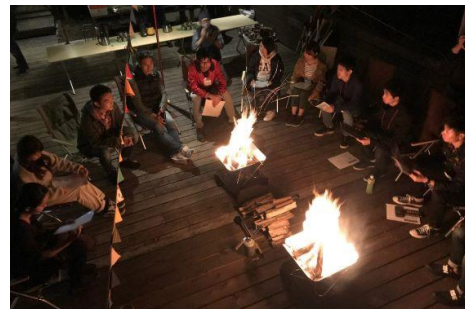
CAMPING OFFICE HAYAMA