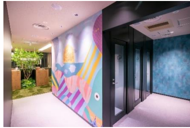
ワークスタイリング SOLO (ワークスタイリング新百合ヶ丘)