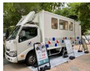
整体・マッサージ