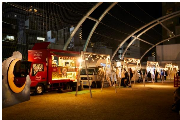
「MIYASHITA PARK CHRISTMAS PARTY」イメージ

MIYASHITA PARK 4階の渋谷区立宮下公園にて、「#LOVE PURPLE」のメッセージを体感しながら楽しめるクリスマスマーケット「MIYASHITA PARK CHRISTMAS PARTY」を開催いたします。MIYASHITA PARK 初開催となるクリスマスマーケットのテーマは「大切な人と、愛深まる時間を」。「MIYASHITA CHRISTMAS PARK 2022」の全体メッセージである「#LOVE PURPLE」をイメージした空間演出やフォトブース、大切な人とここでしか味わえないフードや音楽など、様々なコンテンツをご用意しています。