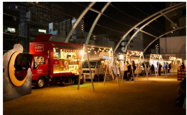
「MIYASHITA PARK CHRISTMAS PARTY」イメージ