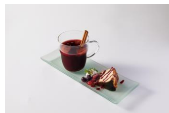
GRAN SOL TOKYO