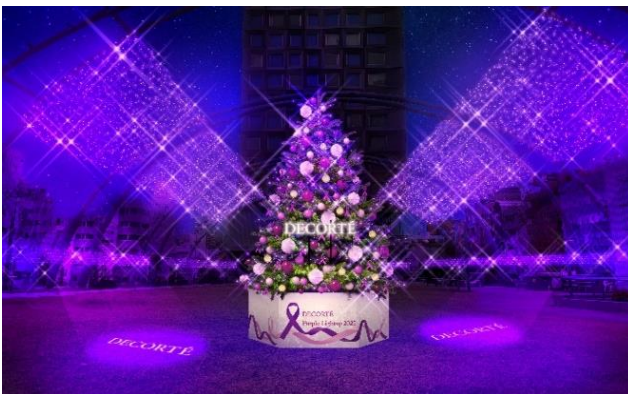
「DECORTÉ Purple Lightup 2022」イメージ

イベント期間中は、コスメデコルテ協賛によるイルミネーション「DECORTÉ Purple Lightup 2022」のほか、アーティストとコラボレーションしたオリジナルクリスマスソングの配信、そしてクリスマスマーケット「MIYASHITA PARK CHRISTMAS PARTY」など、渋谷の街に新たなクリスマスの風景を作り出します。ダイバーシティの街、ここ渋谷 MIYASHITA PARK でしか味わえない、特別なクリスマスを是非お楽しみください。