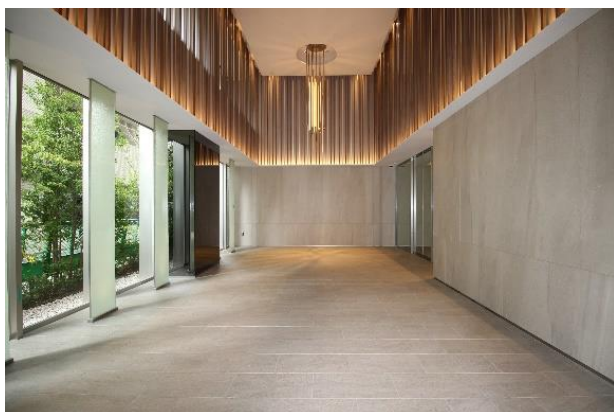
【パークホームズ初台 ザ レジデンス】 エントランスホール