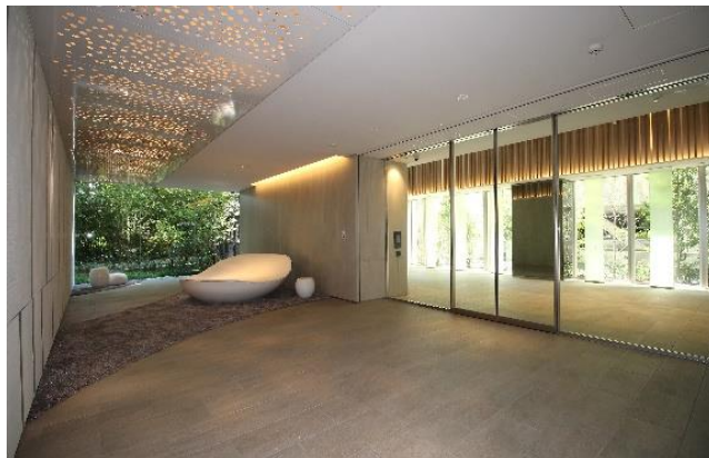
【パークホームズ初台 ザ レジデンス】 ラウンジ