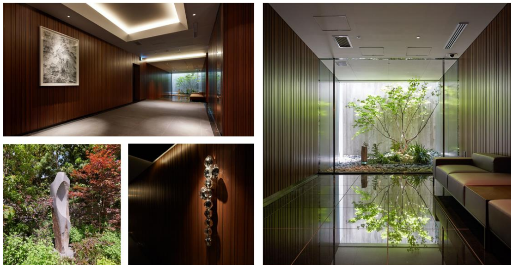
【アートワークコレクション・坪庭】