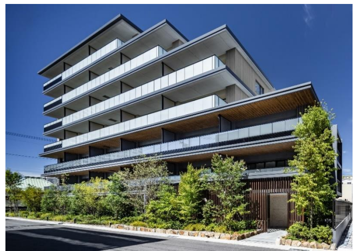
【パークホームズ登戸スクエア】

デザイナー：UDS 株式会社 株式会社ヨシモトアソシエイツ 設計：株式会社アトリエシーブ設計事務所 施工：西武建設株式会社