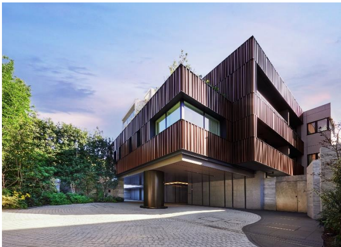
【パークコート白金長者丸】

今後も当社住宅事業のブランドコンセプト「Life-styling × 経年優化」のもと、多様化するライフスタイルに応える商品・サービスをご提供するとともに、安全・安心で末永くお住まいいただける街づくりを推進することで、持続可能な社会の実現・SDGsへ貢献してまいります。