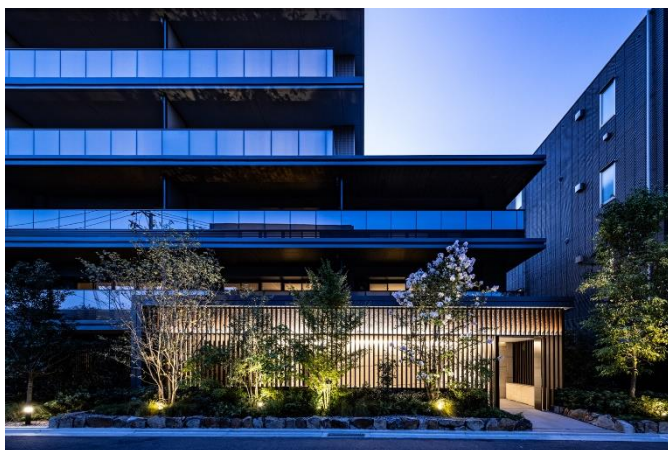
【エントランスアプローチ】

小田急線・JR 南武線「登戸駅」徒歩 5 分の住宅街にある総戸数 52 戸、7 階建ての分譲マンション。計画地周辺は従前、宿場町として栄えており、計画地にも老舗日本料理屋「柏屋」が佇んでいました。その歴史を継承しつつ、多摩川や生田緑地をはじめとした自然の豊かさや、土地区画整理事業による新しい街への期待感を同時に感じられる、「ゆとりある住まい」を目指しました。