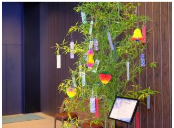
七夕イベントの様子 (三井ガーデンホテル日本橋プレミア)

※三井ガーデンホテル仙台は 2022 年 7 月 5 日より 8 月 10 日に開催 ※撮影時のみマスクを外しています