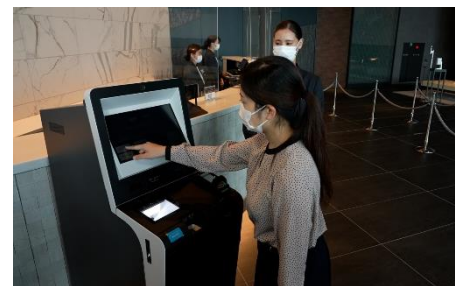
自動チェックイン機導入による接触軽減