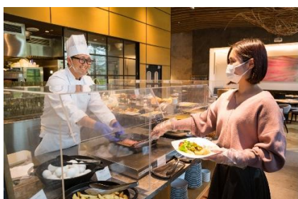
レストラン店内のアクリルボード設置とマスク・手袋着用徹底(ビュッフェ)