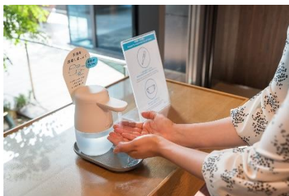
入館、館内施設利用時の検温と消毒