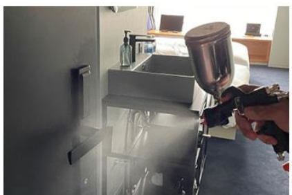
客室内の消毒と抗菌対策の徹底