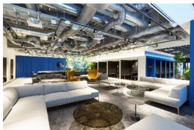
ワークスタイリング SHARE (ワークスタイリング八重洲)

ワークスタイリングは、三井不動産が展開する法人向けシェアオフィスです。全国に広がる拠点を10分単位で利用可能な法人向け多拠点型サテライトオフィス「ワークスタイリング SHARE」、郊外エリアを中心とした法人向け個室特化型サテライトオフィス「ワークスタイリング SOLO」、多様化する企業のニーズや様々なビジネスシーンに合わせた法人向けフレキシブルサービスオフィス「ワークスタイリング FLEX」を展開しています。三井不動産グループが提供する国内全40か所の「ザ セレスティンホテルズ」「三井ガーデンホテルズ」「sequence」「東京ドームホテル」等提携拠点と併せて、2022年7月20日(水)時点で149拠点を展開し、800社超、約24万人にご契約いただいています。