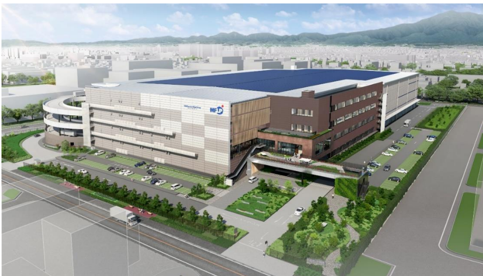
<外観イメージパース>

『ZEB』認証を取得し、太陽光発電とトラック付非化石証書の活用により再生可能エネルギーを 100%供給可能とすることで、利用実態に合わせた施設全体の CO2 排出量実質ゼロを目指した環境配慮型施設(商標登録済み)