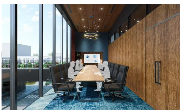
＜プレゼンテーションルームイメージパース＞