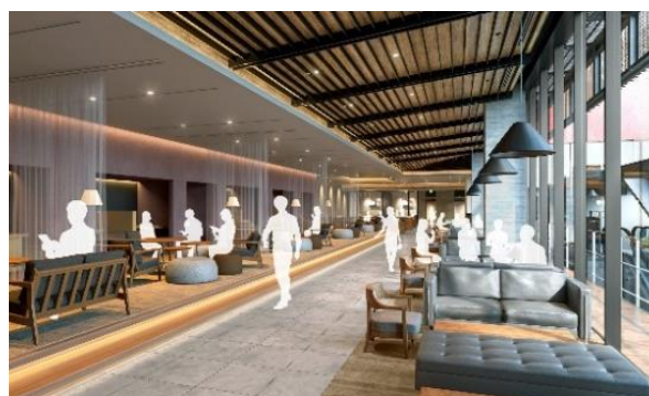
＜ラウンジイメージパース＞