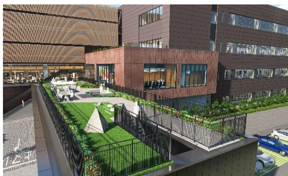
＜デッキテラスイメージパース＞