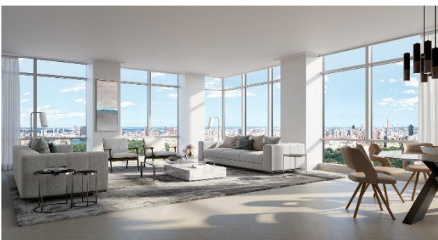
専有部 リビングルーム CG