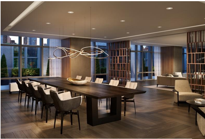
共用部 ダイニングルーム CG

200 アムステルダムは、アッパーウェストサイドエリアでは貴重な新築の超高層タワー（地上 51 階建て、112 戸）です。セントラルパークやハドソン川を望む高層階からの眺望に加え、ダイニングルームやラウンジ、フィットネスルーム、ソルトウォータープールなど充実の共用施設が特徴となっています。本事業は、ニューヨーク市を中心に、住宅及びオフィスビルの豊富な開発実績を有する SJP Properties 社との共同事業です。