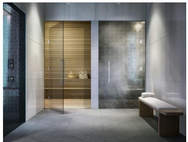
共用部 スパルーム CG