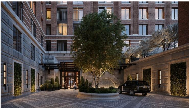
エントランス前車寄せ CG

コートランドは、ハドソン川至近という立地特性を活かし、全体の約半数の住戸からハドソン川を臨める設計となっています。また、144 戸と住戸数も多く、大規模物件であることを活かして、イベントラウンジ、キッズルーム、スカッシュコート、フィットネスやプールなどの共用施設や、マンハッタンには希少な車寄せのスペースも備えています。本事業は、ニューヨークを拠点とし、当社とも「55 ハドソンヤード」「50 ハドソンヤード」で事業実績がある、Related 社との共同事業です。