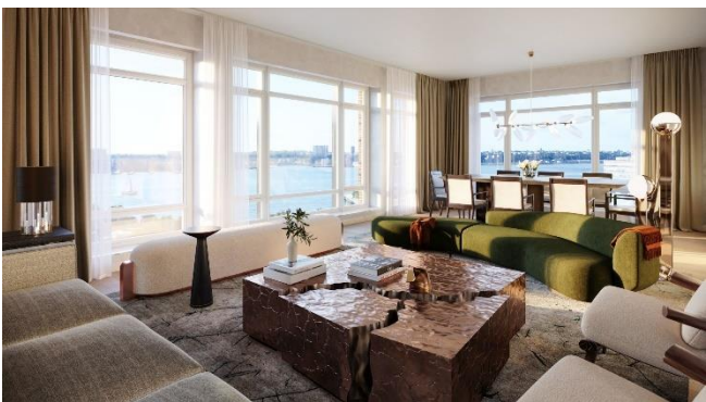
住宅専有部 リビングルーム CG