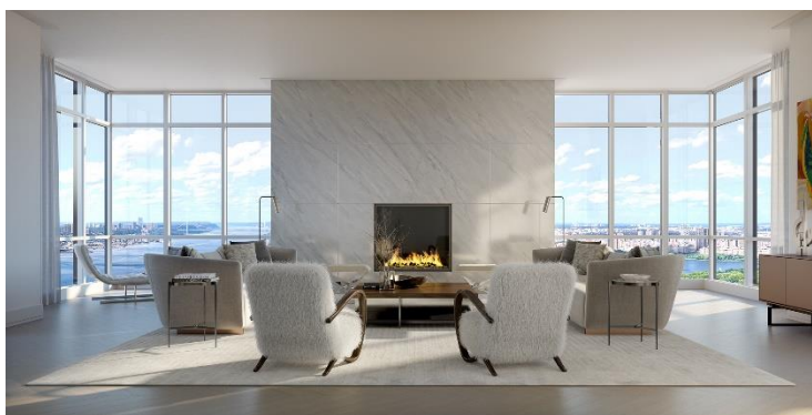
(左)「コートランド」外観 CG (右上)「200 アムステルダム」外観 CG (右下)「200 アムステルダム」住宅専有部 リビングルーム CG