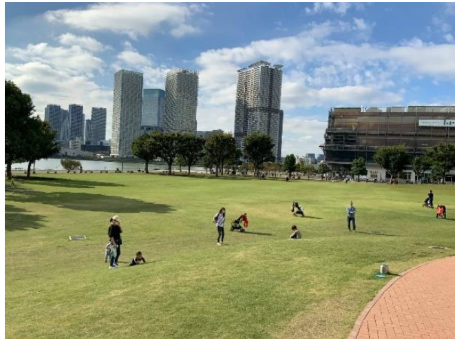
豊洲公園イメージ