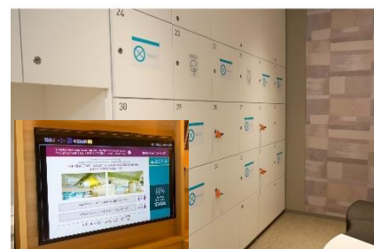
大浴場の利用制限と客室のテレビモニターで利用状況の確認