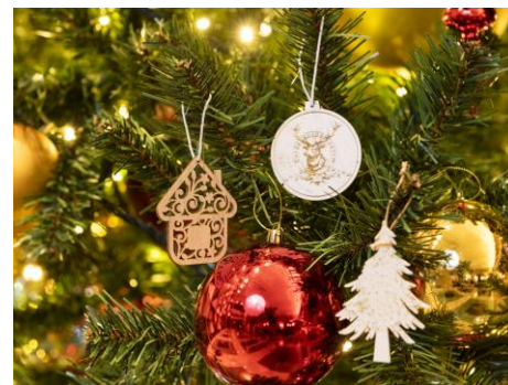
ハンドメイドオーナメント