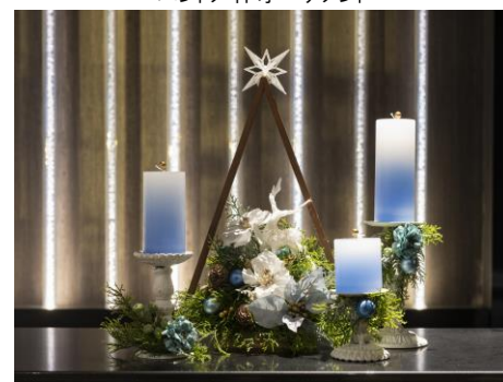
ハンドメイドキャンドル装飾