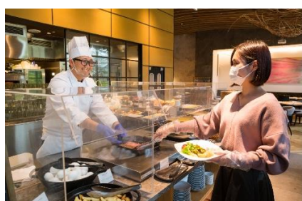
レストラン店内のアクリルボード設置とマスク・手袋着用徹底(ビュッフェ)