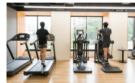
フィットネスなどパブリックスペースの人数制限と消毒の徹底