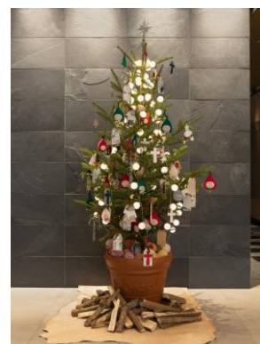
オリジナルクリスマスツリー

https://www.tachikawa-shakyo.or.jp/group/sou-npo/