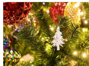
ハンドメイドオーナメント

【制作協力】 社会福祉法人未来のこどもランド「就労継続支援B型 すまいる・フォレスト」