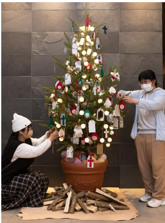
オリジナルツリー

ホリデーシーズンならではのハンドメイドデコレーションをお楽しみいただきながら、笑顔あふれる心あたたまるクリスマスのひとときをお楽しみいただきたいという想いを込めて企画いたしました。