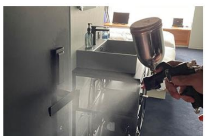
客室内の消毒と抗菌対策の徹底