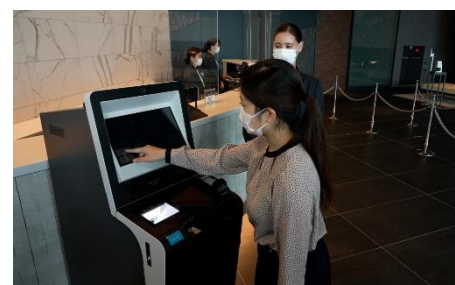
自動チェックイン機導入による接触軽減