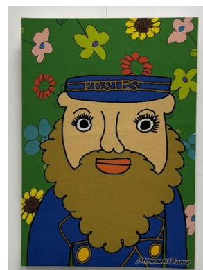
ハッピースマイルアート

https://grouphappysmile.wixsite.com/happysmile