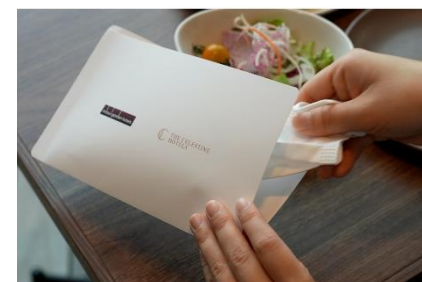
レストラン店内ではマスクケースをご用意