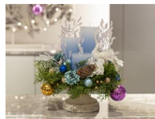
ハンドメイドキャンドル