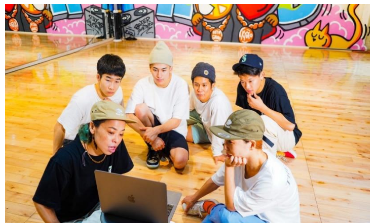
<自分らしさを表現する大切さを伝える講師の様子>