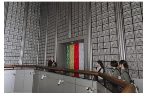
階段をのぼり数メートル下の「仏足石」を ご覧いただけます。

※ 上記の流れは目安です。当日の状況によって変更になる場合がございますので、あらかじめご了承ください。