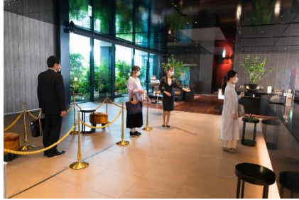
フィジカルディスタンスの確保