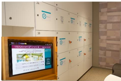
大浴場の利用制限と客室のテレビモニターで利用状況の確認