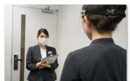
スタッフの体調管理の徹底