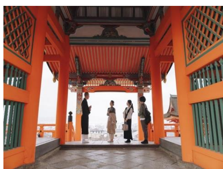
通常非公開の清水寺にある 重要文化財や名庭をご覧ください。