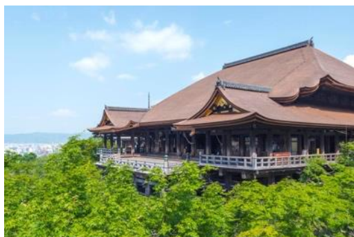
世界遺産 清水寺の境内を 清水寺の和尚が直接ご案内します。

778年開創、約1200年の歴史を誇る京都の名所、清水寺。重要文化財を含む非公開の境内を清水寺の和尚が特別にご案内いたします。通常参拝では立ち入ることができない貴重な空間で、見て、聴いて、感じて、全身で清水寺の世界をご堪能いただけます。