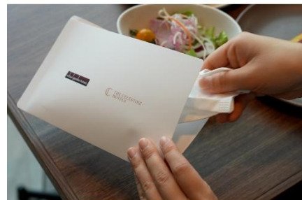
レストラン店内ではマスクケースをご用意