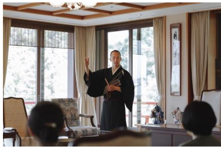
非公開の大広間にて 清水寺の和尚が直接ご案内します。