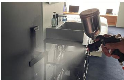
客室内の消毒と抗菌対策の徹底