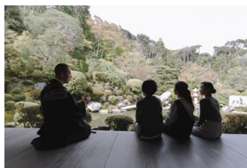
普段立ち入れない内陣で 清水寺の御本尊を目の前に参拝いただけます。