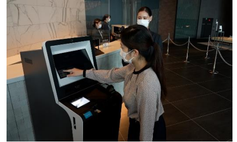
自動チェックイン機導入による接触軽減