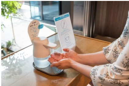
入館、館内施設利用時の検温と消毒