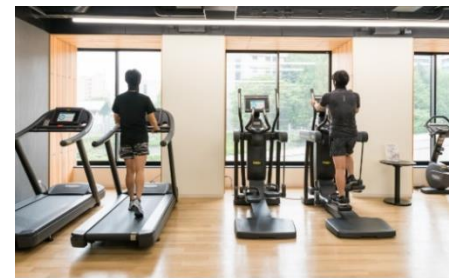
フィットネスなどパブリックスペースの人数制限と消毒の徹底