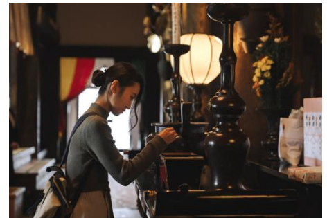
内陣でご本尊を間近に参拝いただけます。