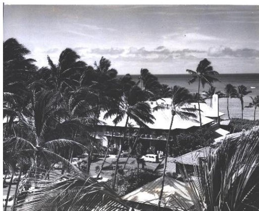
1932 年竣工のメインビルディング(1950 年撮影)

5 棟の建物は、市街地に背を向け、海に向かってアルファベットの「E」の字型に配置されました。宿泊客にワイキキビーチの眺望を楽しんでいただくために、ほぼ全ての客室から、プールや中庭越しにハワイの青い海が眺められる設計となっています。