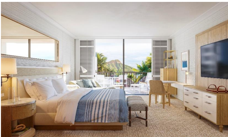
客室 リニューアル後イメージ

ハワイアンミュージックの生演奏とフラダンスが楽しめる人気レストラン「House Without A Key(ハウス ウィズアウト アキー)」では、ハレクラニの象徴のひとつである樹齢 130 年を超えるキアヴェツリーや、ワイキキビーチ、ダイヤモンドヘッドまでを一望できるようにエントランスを再設計しています。新設される屋外バー、ガラス張りのオープンキッチン、モダンな家具といった新たな設えとともに、2021 年 11 月下旬の営業再開を予定しています。