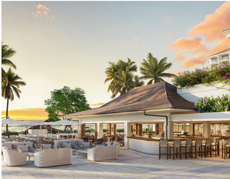
「House Without A Key」リニューアル後イメージ 新設の屋外バー

そして今般、建物の主要設備類の更新や基本性能の維持向上、パブリックスペースやスイートを含むすべての客室の家具、什器類の刷新等大規模なリニューアルを行い、新たなハレクラニへと生まれ変わりました。