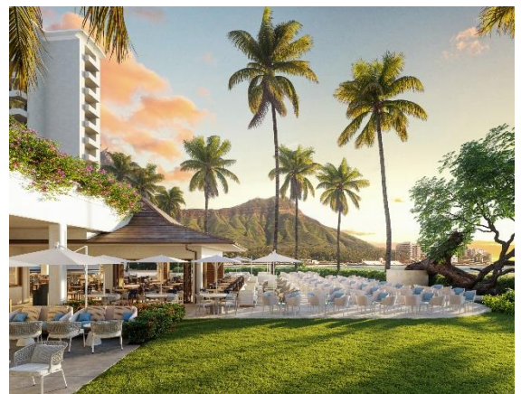
「House Without A Key」リニューアル後イメージ