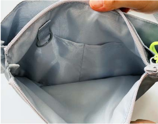
ファスナー側収納