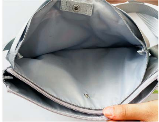
スナップボタン側収納