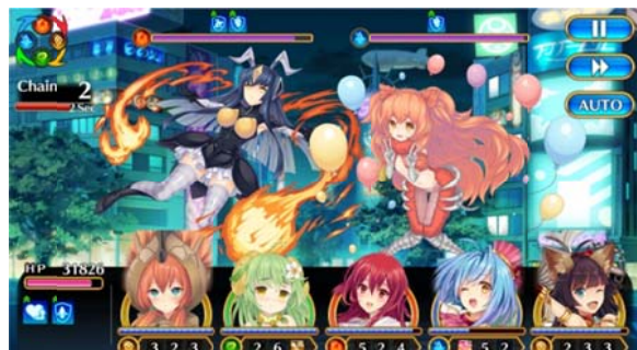
スペシャルクエスト「怪獣娘襲来！」バトルパート画面