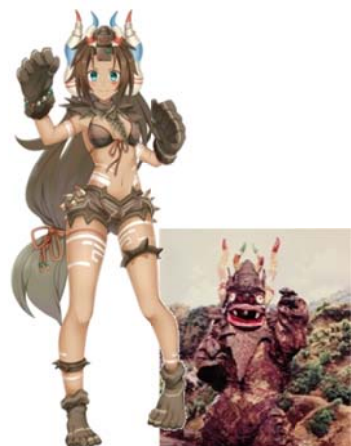
(C)円谷プロ (C)「怪獣娘(ウルトラ怪獣擬人化計画)」製作委員会