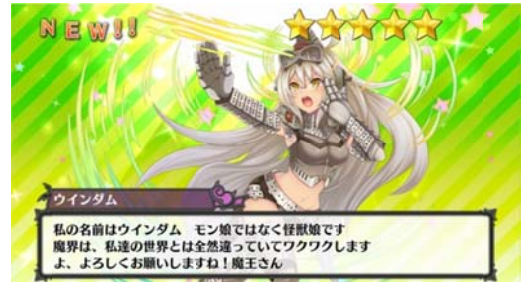
ガチャ画面(ウイングダム登場)