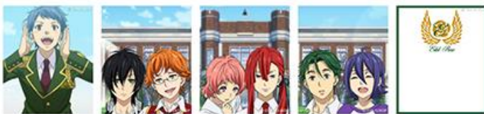
[エーデルローズセット 1]

—撮影フレーム:キャラクターと一緒に撮影しているように仕上がる、撮影背景を計6セット(30種)搭載。