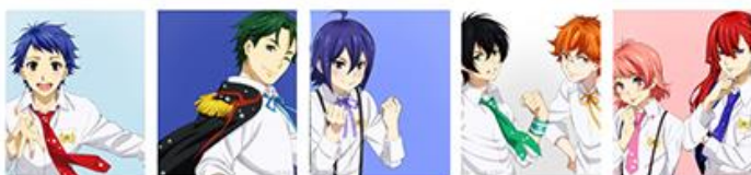
[Music Ready Sparking!セット]