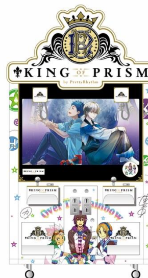
[クレーンゲーム機装飾イメージ]

「キンプリ」の世界観で装飾されたクレーンゲーム機を設置し、アミューズメント施設で展開したプライズ商品を配置予定。