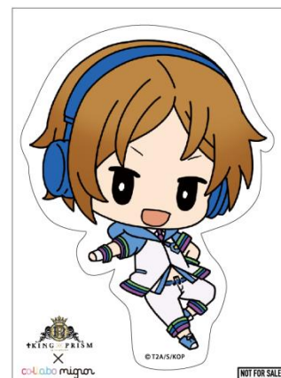
[ステッカーイメージ]