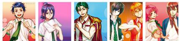
[エーデルローズセット 2]