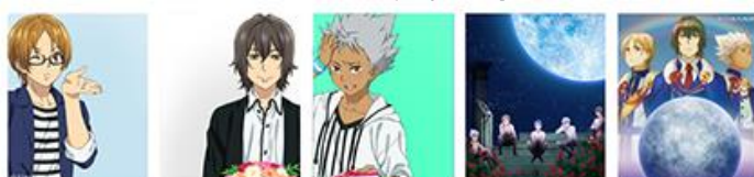
[Over The Rainbow セット]