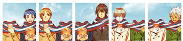
[もふもふマフラセット]