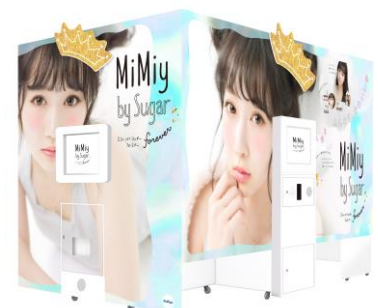
▲『MiMiy by Sugar forever』 本体イメージ