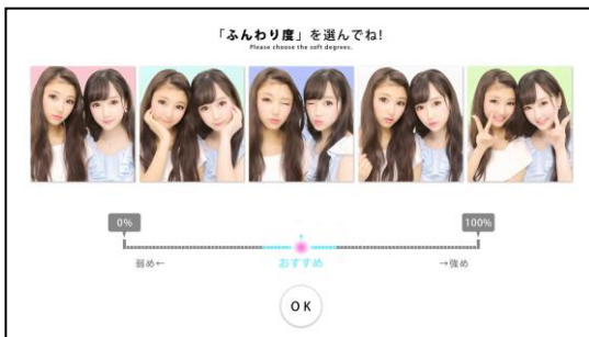
▲「ふんわり度調整」機能操作画面 イメージ

前作より搭載されている、撮影後の画像の【目の形】【目の明るさ】を選択できるレタッチ機能に、新しく顔と目の大きさを調整できる【盛れ感】と、仕上がりのぼかし具合と色味を自身で調整できる【ふんわり度調整】機能を新搭載。より理想的な写りの仕上げを追求する事が可能になりました。