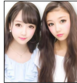
▲写り仕上げり イメージ

髪の毛を1本1本繊細に表現する事で、軽やかで動きのある仕上げをお楽しみいただけます。また、肌はキメ細かな質感は残しつつも、全体として柔らかな光をまとったような“ふんわりかわいい”印象を与える仕上げを実現しています。