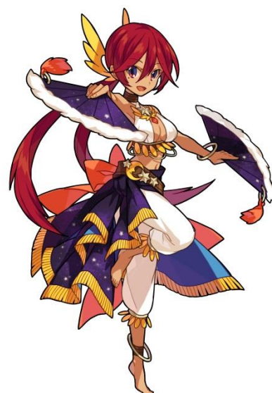
報酬例: ジョブ「踊り子(女の子)」

その他: イベント情報は公式 Twitter( https://twitter.com/battleofangel )や アプリ内ページで告知