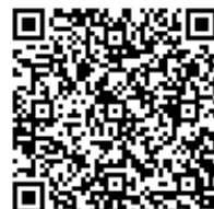
Android 版 QRコード

※Android は Google Inc.の商標または登録商標です。 ※記載されている会社名、製品名などは該当する各社の商標または登録商標です。