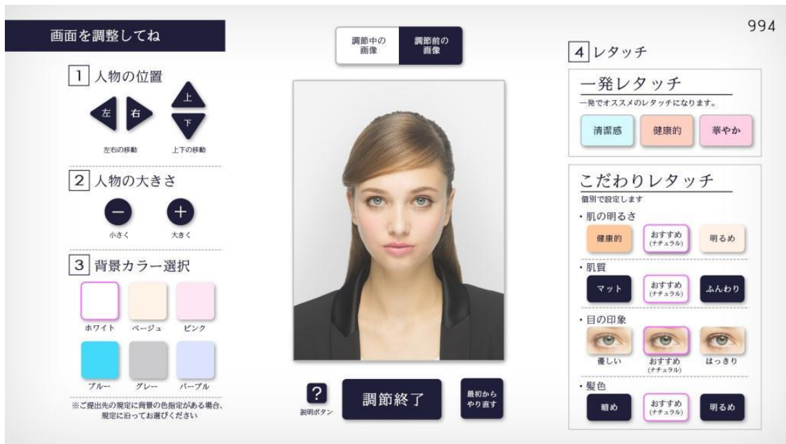
『FURYU BEAUTY STUDIO』画像調整画面

『FURYU BEAUTY STUDIO』では、印刷する前に画面上にて、人物の位置・大きさの調整や、背景カラーの選択、肌の色味や質感などの画像調整が可能です。納得いく仕上がりを確認してから印刷していただけます。