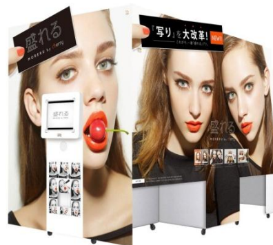
プリントシール機『盛れる by cherry』

※『盛れる by cherry』、『証明プリ』、『FURYU BEAUTY STUDIO』、『一発レタッチ』、『こだわりレタッチ』は、フリー株式会社商標または登録商標です。※会社名、製品名、サービス名等は、それぞれ各社の商標または登録商標です。