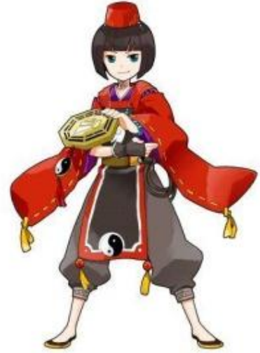
＜イベント限定の新アバター＞