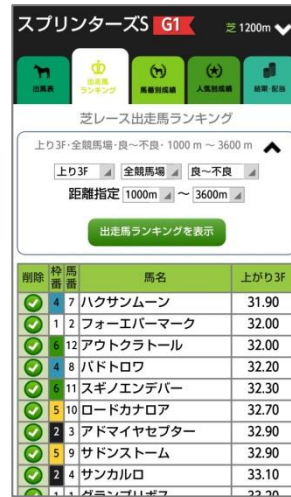
出走馬を上がり3F タイムでランキング

『馬ライズ』は、2009～2013年の5年間の中央競馬のレース結果を元に独自に集計・分析されたデータを搭載しており、利用者自身が必要としているデータをピックアップし、比較・検討がスピーディーにできる競馬情報分析サイトです。au、ソフトバンクのスマートフォンにて、月額420円(税込)でご利用いただけます。秋のGI、重賞レース予想に、ぜひご利用ください。