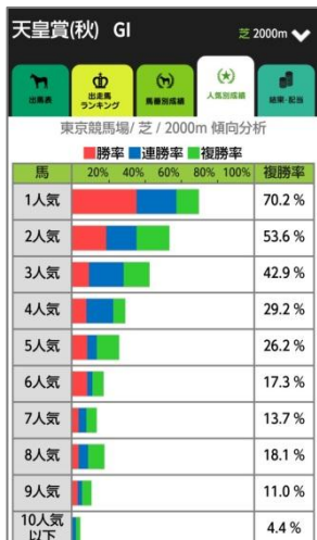
過去の同条件における 人気別成績を表示