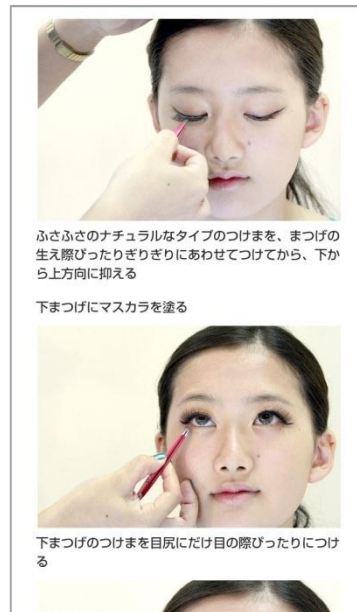
雑誌よりも詳しい メイクアップ工程