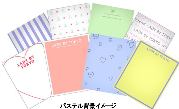
パステル背景イメージ

背景コンテンツがトレンドのデザインを取り入れ全リニューアル。ふんわり可愛いイメージが人気のパステル背景では、ナチュラルで優しい仕上がりに、また、流行のアクセントカラーを集めたビビッド背景では、よりオシャレで印象的な仕上げをお楽しみいただけます。2つのコースで、必ずお気に入りのデザインが見つかります。