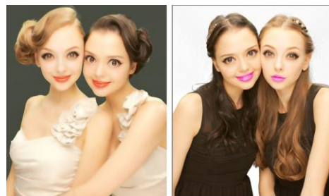
“リップカラー機能”使用イメージ

撮影後の落書き時に、リップの色を変えることができる“リップカラー機能”を新たに搭載。赤やピンクを中心とした華やかで心躍るトレンドカラーをご用意しました。つやめく発色と、自然と肌に溶け込むような色味が唇にフィット。鮮やかなリップカラーのメイクを施すことで明るく可愛い唇を演出します。