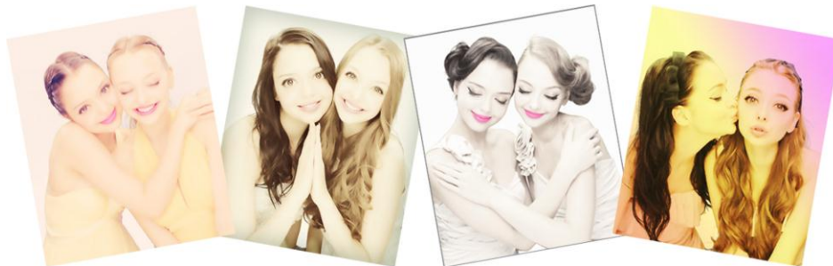
加工アプリ風コース使用イメージ

*2..撮影後、撮った画像を編集して携帯へ送信、その後 SNS などでする画像のこと