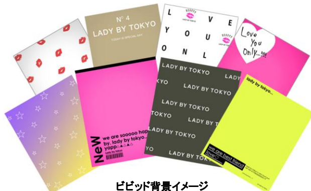
ビビッド背景イメージ