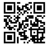
Google Play QRコード