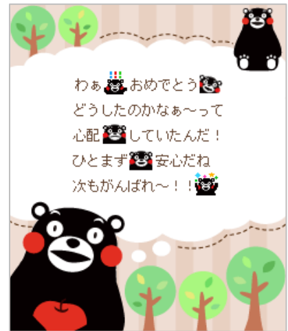
「くまモン」デコメ®用素材 一例

『デコらっちょ』は、面白くてかわいい個性的なデコメ®素材が満載で、男女問わず多くの方からご支持いただいている月額会員制のデコメ®素材サイトです。本サイトで配信する「くまモン」のデコメ®素材は、「くまモン」の可愛らしさあふれる素材から、素材単体でメッセージを伝えることができる素材、個性的なデザインの素材など多岐にわたっており、様々な場面でご使用いただけるバラエティに富んだ素材となっております。また、『デコらっちょ』の他にフリー株式会社が発行するデコメ®サイト『ラクラクえもじっち』、『イベデコ』では「くまモン」の新規デコメ®素材を本日より合計 17 種類追加、『無敵デコランキング』では「くまモン」の素材を 8 種類配信しております。