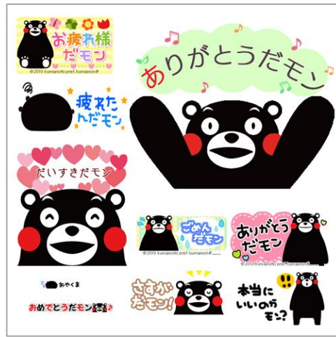
「くまモン」デコメ®素材 一例