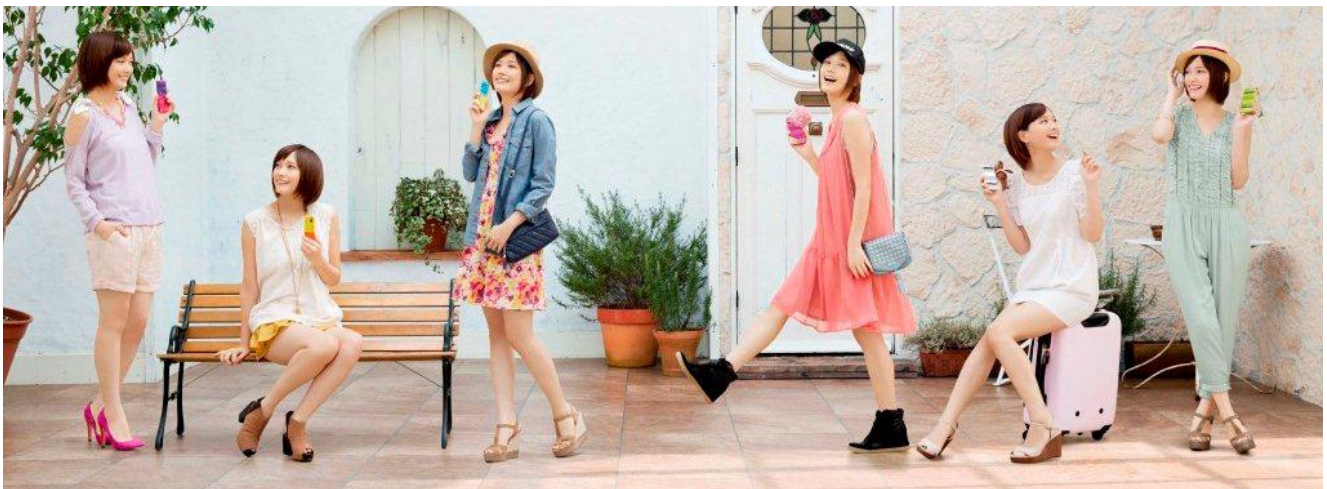
＜「コーディネート投票キャンペーン」の対象となる本田翼さんの6種類のコーディネート＞

フリユー株式会社(本社:東京都渋谷区、以下フリユー)と京セラ株式会社(本社:京都市伏見区、以下京セラ)は、フリユーが提供するファッション・コーディネート共有サイト『RUMOR fashion(ルモアファッション)』において、人気女優・モデルの「本田翼」さんがキャンペーンキャラクターを務める京セラ製スマートフォン「HONEY BEE® SoftBank 201K」(以下、「HONEY BEE®」)とのコラボレーション企画として、「コーディネート投票キャンペーン」と「ちょい足しコーディネートコンテストキャンペーン」を本日2013年2月1日(金)より実施いたします。