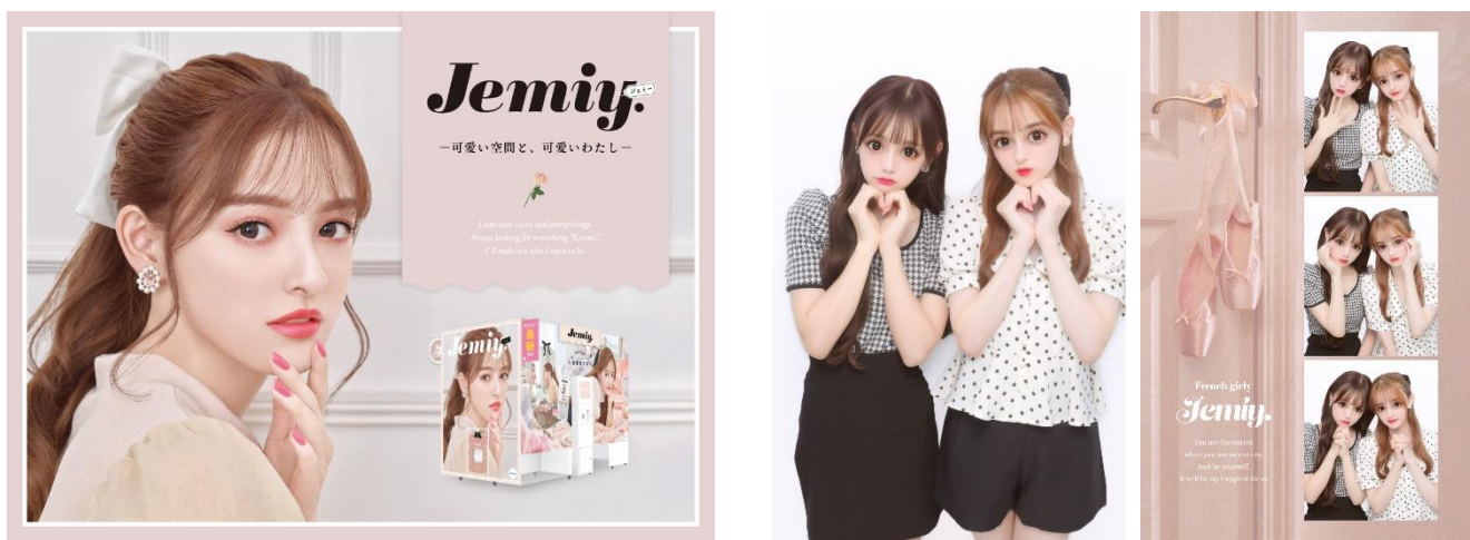
フレンチガーリーな世界観を楽しめる コーデプリ・シール仕上がりがリイメー

『Jemiy.』は、外装・撮影空間・写り・落書き・シールなどの全てを“フレンチガーリー”な世界観で統一。目に入るもの全てが可愛い“特別感溢れるプリ撮影”をお楽しみいただけることが最大の特徴です。フレンチガーリーとは、ガーリーさと上品さを併せ持つテイストで、若年女性を中心に絶大な人気を集めています。