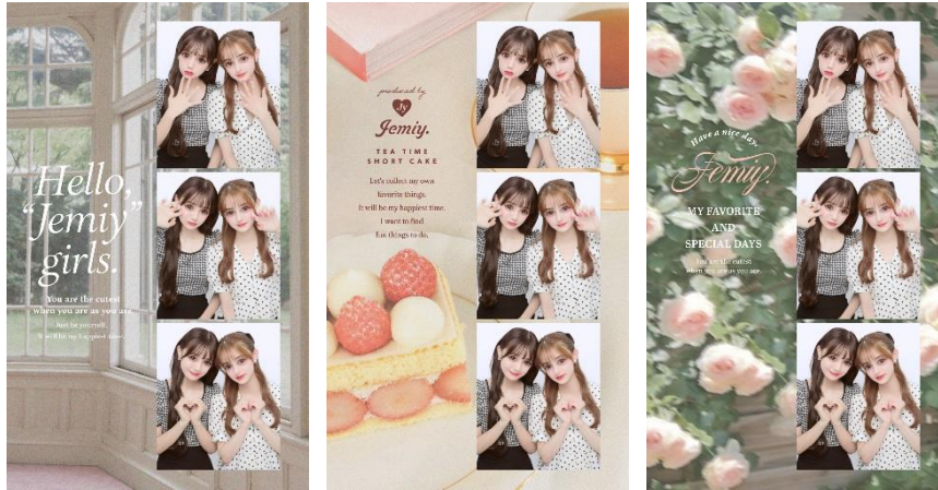
実写風が新しく可愛い！フレンチガーリーデザインのシールイメージ

シールは、“甘くて上品盛れ”なプリを引き立たせる計 17 種類のデザインを取り揃えました。花・ケーキ・小物などフレンチガーリー感のある写真をアレンジした実写風デザインもご用意し、可愛さの中にも大人っぽさを感じられる仕上がりをお楽しみいただけます。また、選んだシールデザインや撮影したプリの雰囲気に合わせて、ホワイト・ピンク・ベージュ・グレー4種類の中から好みのフィルターをシール全体に施すことも可能。フレンチガーリーな世界観を存分に感じられるおしゃれなシールは、透明のスマホケースに挟んだり、SNS へのアップにも最適です。