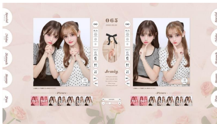
フレンチガリーデザインの落書き画面イメージ