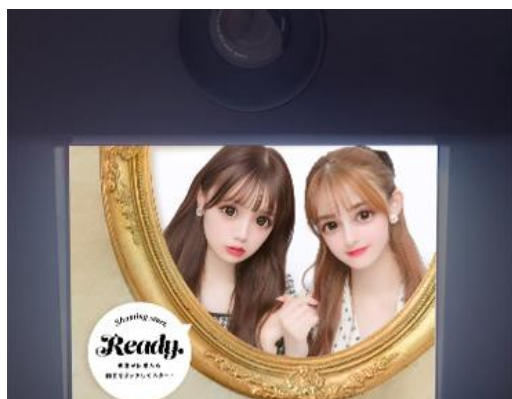
撮影前にはカメラ下の可愛い画面を見ながら身だしなみ調節が行える