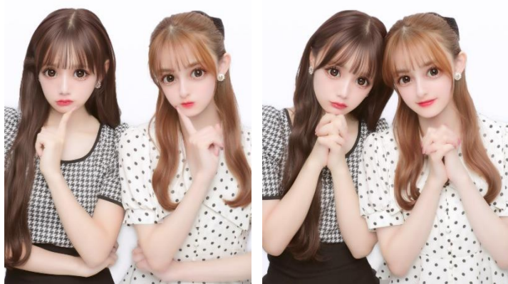
「まるみ eye」×「すっきりフェイス」で叶える“甘くて上品盛れ”な写り

さらに、落書き時には顔のパーツをそれぞれ調節しなくても、メイク・小顔・目の形の加工がワンタップで反映される「フレンチメイクセット」を搭載。ピンク系メイクとまる目で可愛いお人形のような顔になれる「ドーリーメイク」、赤リップとネコ目で大人っぽさをプラスする「儂げメイク」の2種類をご用意しました。また、メイクに合わせてピンク・ホワイトのフィルターをプリに施すことも可能。なりたいイメージやその日のメイク・ファッションに合わせてメイクとフィルターを選択すれば、より自分好みの仕上がりを追求いただけます。