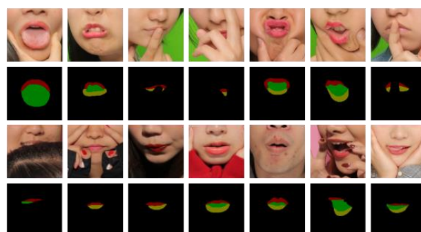
複数データを学習させておくことで事前学習していない形状にも対応が可能になり、“盛れる写り”が実現

これにより、思い思いの表情・ポーズで撮影しても、正しいくちびるの位置にきれいな口紅の加工が付き、“盛れる写り”を実現することができました。