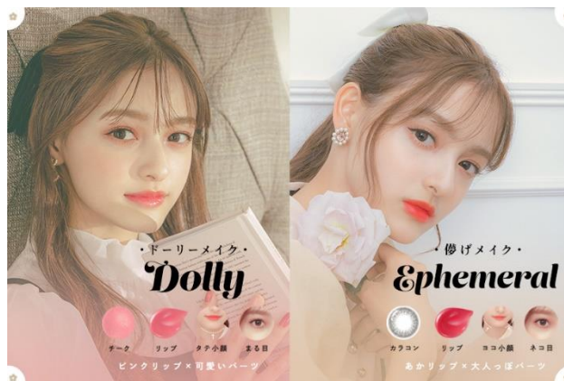
なりたいイメージにあったメイク・レタッチが簡単に施せる