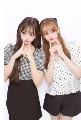
「コーデプリ撮影」仕上がリイメージ

また、フレンチガリーな世界観に浸りながら撮影や落書きを行えるのも魅力。撮影前には、ライブビューモニターにアンティーク風の額縁をイメージした装飾が出現。画面をアンティークミラーに見立ててメイクや前髪など身だしなみを整えることが可能です。落書き画面には、花のモチーフをあしらった淡い色味で統一した上品なデザインを採用。可愛い空間で撮影準備や落書きができ、自然とテンションもアップすること間違いなしです。