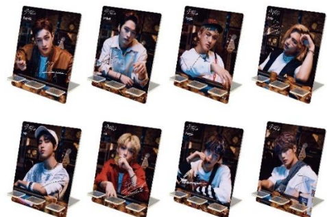
スマホスタンド(全8種/約17cm)