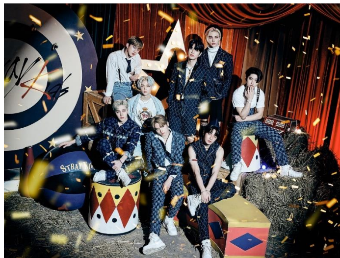
直筆サイン入りポスターデザイン(B2 サイズ) ※こちらのデザインにサインが追加されます。