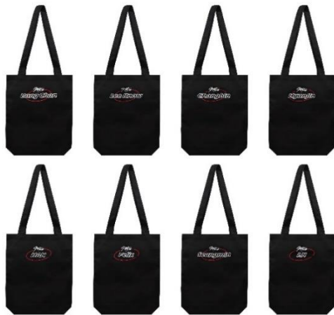
トートバッグ(全8種/約36cm)

7月は、セット使いも楽しめる「トートバッグ」と「バッグチャーム」が登場します。A4サイズが入る「トートバッグ」にはメンバーの名前をデザイン。「バッグチャーム」はJAPAN 1st Mini Album『ALL IN』のビジュアルをサイン入りチェキ風にデザインし、チェーン部分にはグループロゴとメンバーの名前が入ったロゴプレートも付属する豪華仕様です。両方ゲットして、バッグに“推しメンバー”のバッグチャームを付けて楽しむのもおすすめ。