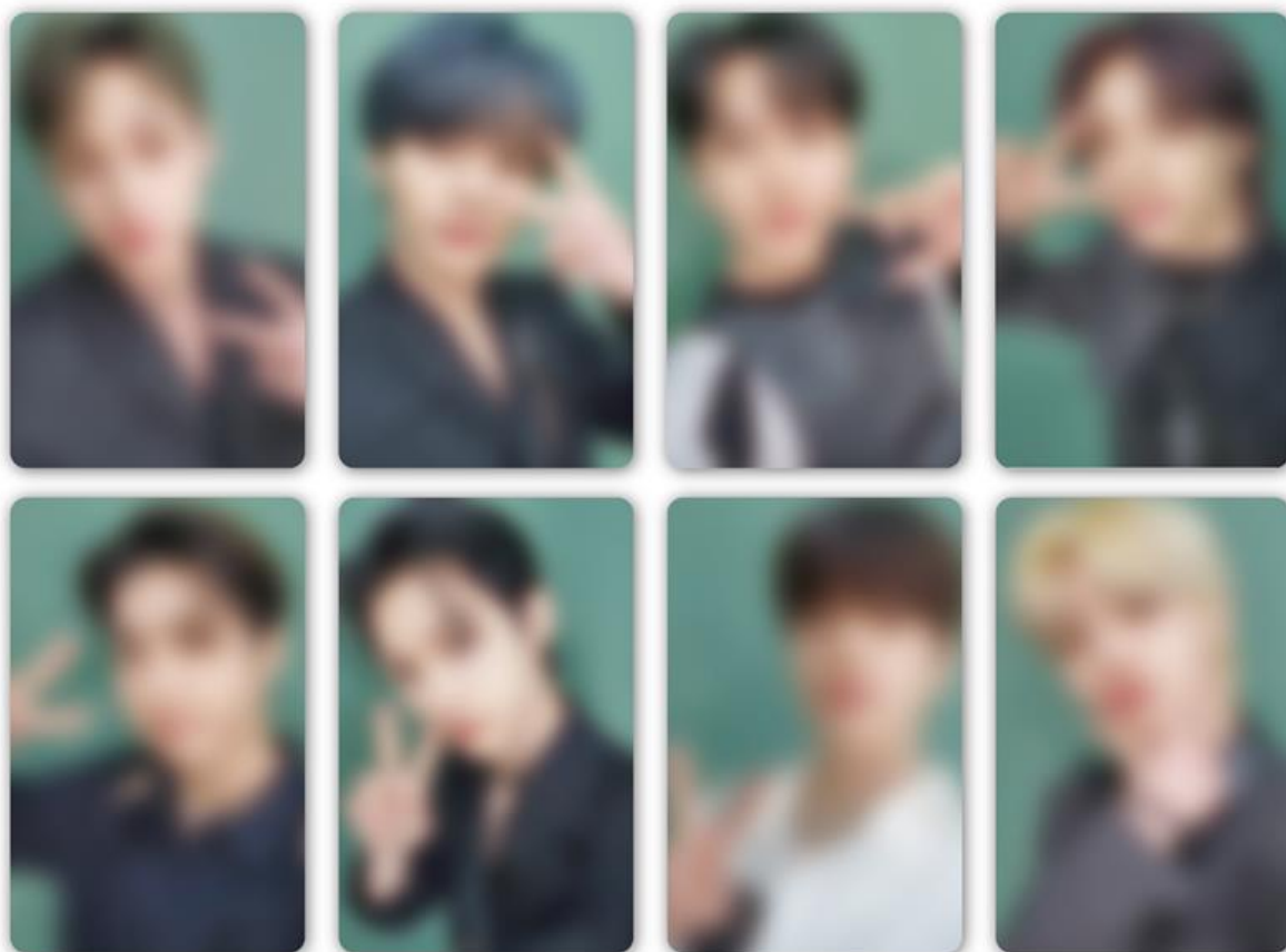
限定撮り下ろしソロフォトカード イメージ(約 8.5cm)