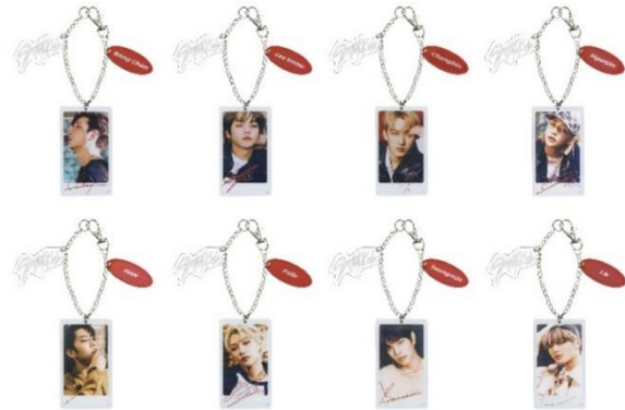
バッグチャーム(全8種/約9.5cm)