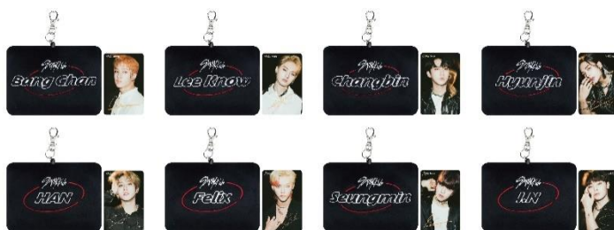
パスケース(全8種/約14cm)

ラストとなる8月下旬には「パスケース」と「スマホスタンド」をラインナップ。リール付の「パスケース」には、JAPAN 2nd Single『Scars / ソリクン -Japanese ver.-』のビジュアルを使用したメンバーのフォトカードがセットになっています。実用的な「スマホスタンド」は、並べて飾るとアートパネルとしても楽しめます。