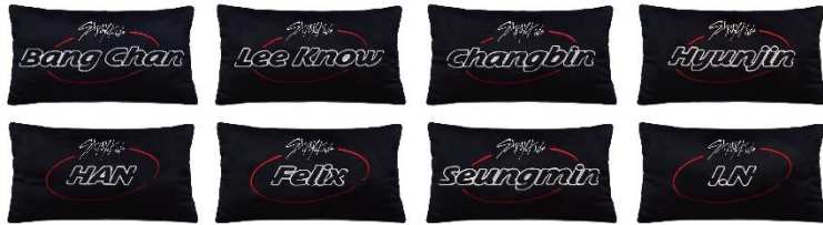
BIGクッション(全8種/約45cm)

「BIGクッション」はボリュームあるサイズ感とメンバーの名前が入った刺しゅうのデザインがポイント。「BIG缶バッジ」は、記念すべき日本デビュー曲となるJAPAN 1st Single『TOP -Japanese ver.-』のビジュアルが見どころ。裏側にはスタンドが付いており、棚や机の上などに立ててディスプレイすることも可能です。