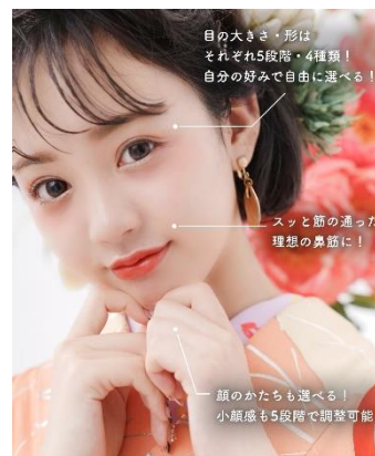
調整ツール 操作画面イメージ