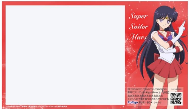
「スーパーセーラーマーズ」