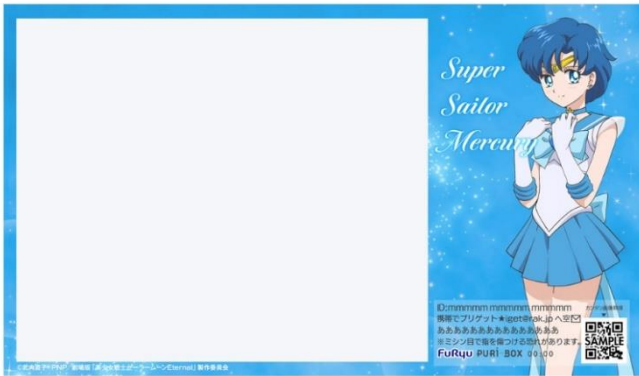
「スーパーセーラーマーキュリー」