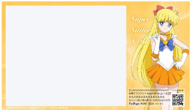
「スーパーセーラーヴィーナス」