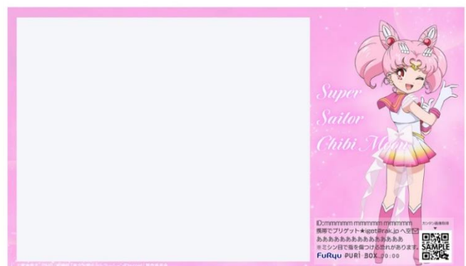
「スーパーセーラーちびムーン」