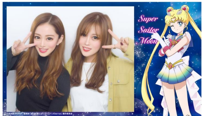
可愛すぎるシールふちデザインを含む画像のダウンロードが可能

本コラボでは、『PURi BOX』にて『劇場版「美少女戦士セーラームーン Eternal」《前編》プリコラボモード』を選択いただくと、印刷時に設定できるシールふちに限定デザインが登場。「スーパーセーラームーン」、「スーパーセーラーちびムーン」、「スーパーセーラーマーキュリー」、「スーパーセーラーマーズ」、「スーパーセーラージュピター」、「スーパーセーラーヴィーナス」の全6種類の中から好みのデザインでプリを印刷いただけます。また、可愛すぎるシールデータは、お手持ちのスマートフォンにダウンロード*が可能で、SNSなどへの投稿にもおすすめです。