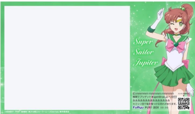
「スーパーセーラージュピター」