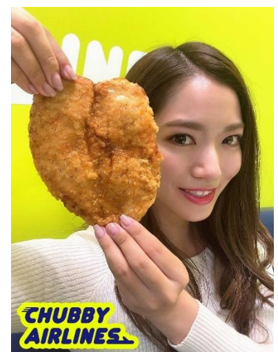
顔が隠れそうほどビッグなチキン

なお、本商品は店内での飲食も可能。さらに、店内でご利用のお客様には、クリスマスムード満点のオリジナルトレーシートと共にフードを提供します。