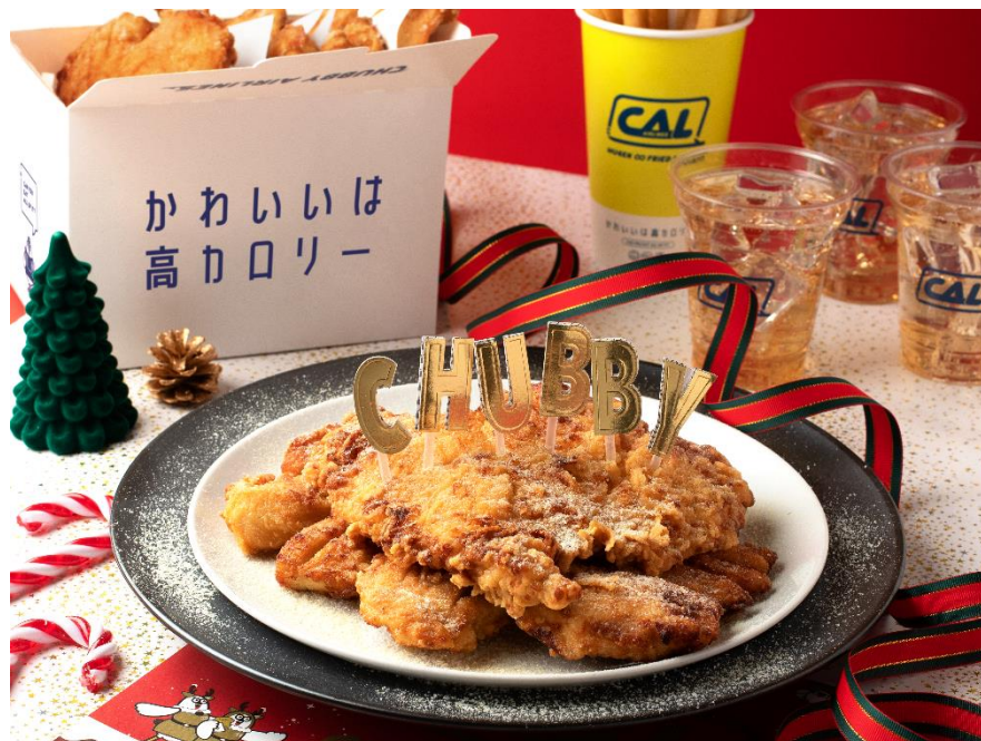
ボリューム満点で一度食べたらクセになる「無限∞チキン」が満腹クリスマスをお届け

“かわいいは高カロリー”をコンセプトにボリュームミーフードを提供するファストフード店『CHUBBY AIRLINES(チャビーエアラインズ)』(プロデュース:フリュー株式会社、場所:イクスピアリ)は、クリスマスシーズンには外せない“チキン”を5枚セットでお楽しみいただける「無限∞チキンBOX」の販売を本日12月1日(火)より開始いたしました。