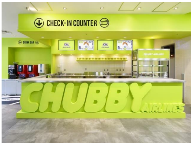
航空会社のチェックインカウンターをイメージした レジカウンター