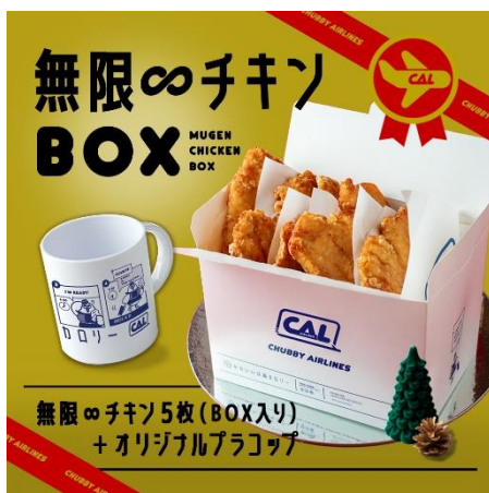
オリジナルプラコップは数量限定

『CHUBBY AIRLINES』電話番号: 047-305-5793(営業時間内におかけください)