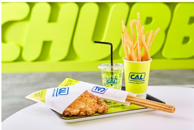
「無限∞チキン」の他、ロングフライドポテトやチュロスなども