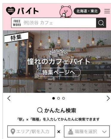
トップページイメージ