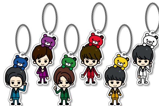
超特急 × PansonWorks クリアマスコット② (全6種/約10cm)