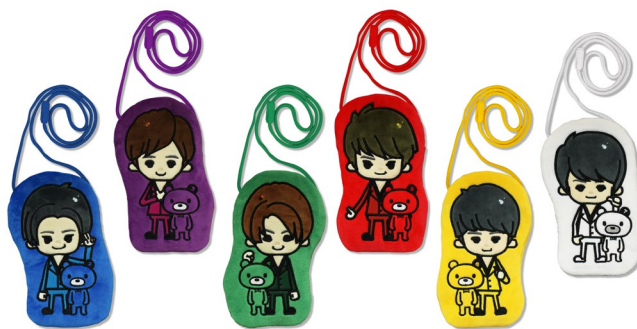
超特急 × PansonWorks アップリケポーチ (全6種/約17cm)