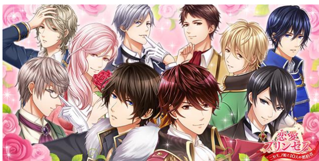
『恋愛プリンセス～ニセモノ姫と10人の婚約者～』メインビジュアル

好きなキャラクターのコーディネートを作ったり、ゲーム内に登場する甘い恋愛シーンを「あいさつ」の画面で楽しんだり、『恋愛プリンセス』の世界観を体感できるコンテンツとなっております。