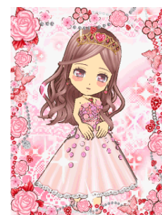
コーディネート例