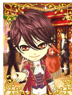
アバター コーディネート例