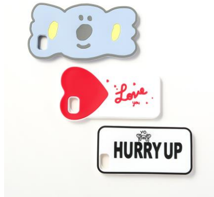
iPhone6/6S/7/8 ケース (コアラ、ハート、HURRY UP) 各 200 円