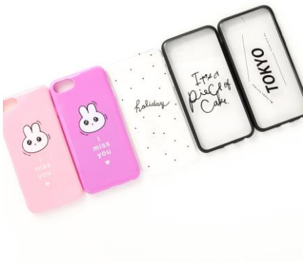
iPhone 用ケース(6/6S/7/8) ウサギ、Holiday 各 100 円 ピースオブケイク、TOKYO 各 150 円