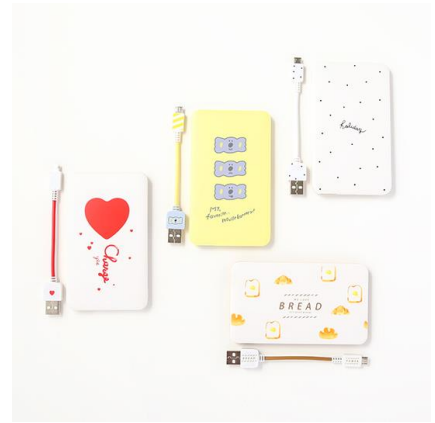
3000mAh モバイルバッテリー (ハート、コアラ、Holiday、パン) 各 500 円