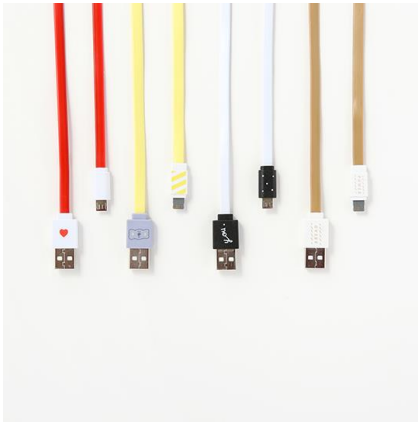
ライトニング充電ケーブル 60cm (ハート、コアラ、Holiday、パン) 各 200 円