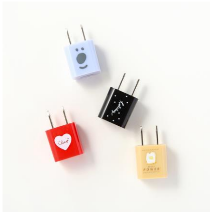
iPhone 用 1.0A USB AC アダプタ (ハート、コアラ、Holiday、パン) 各 300 円