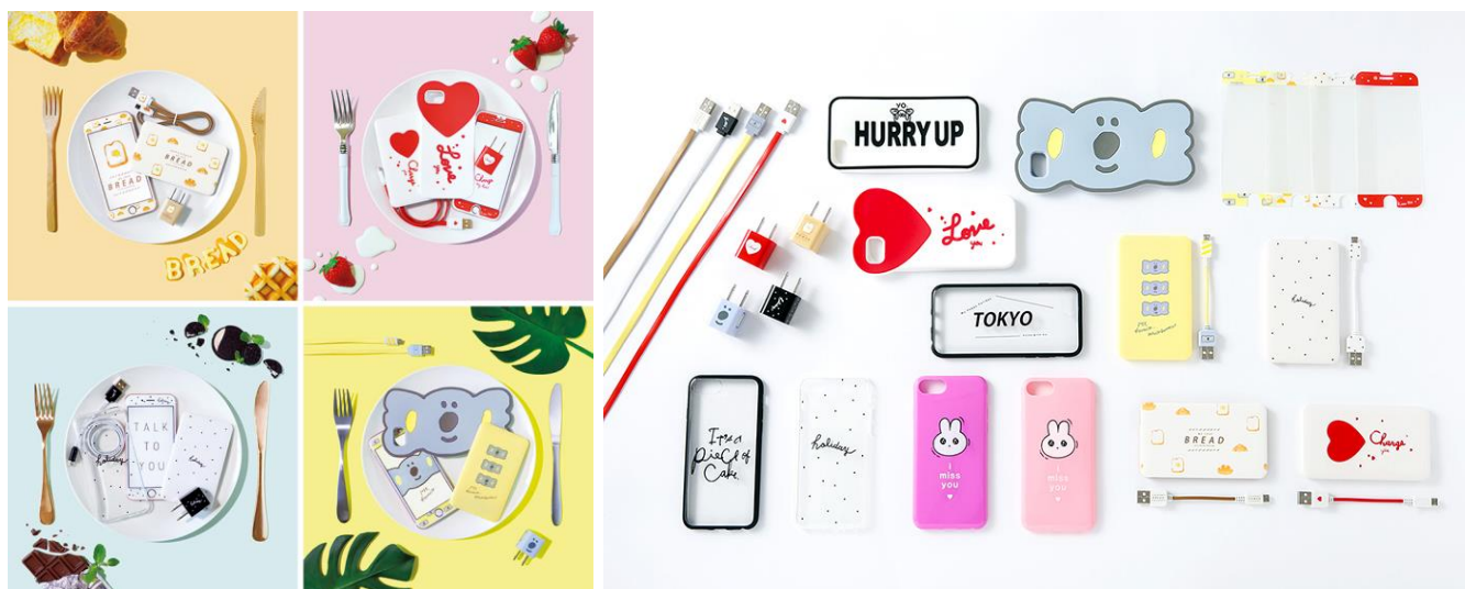
ダイソー×フリュー『GIRLS' TREND 研究所』“Mobile Series”商品イメージ

株式会社大創産業(本社:広島県東広島市、代表取締役社長:矢野博文、以下 ダイソー)と、フリュー株式会社(本社:東京都渋谷区、代表取締役社長:田坂吉朗、以下 フリュー)が運営する女子高生・女子大生の動向調査・研究機関『GIRLS' TREND(ガールズトレンド) 研究所』(所長:稲垣涼子)は、ダイソー×フリュー『GIRLS' TREND 研究所』コラボレーションの新商品として、“Mobile Series(モバイルシリーズ)”を2月15日(木)より全国の「ダイソー」にて順次販売いたします。本コラボレーション(以下、コラボ)は2016年より開始し、多くの方から好評をいただいております。