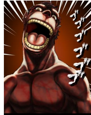
※画像は開発中のものとなり、変更となる場合がございます。