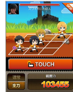
※画像は開発中のものとなり、変更となる場合がございます。