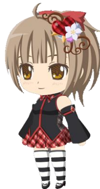
※[チェック&ボーダー][チョコサージュ]装着イメージ