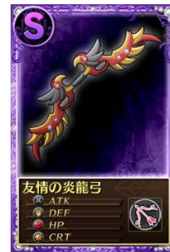
※画面は開発中のものです。