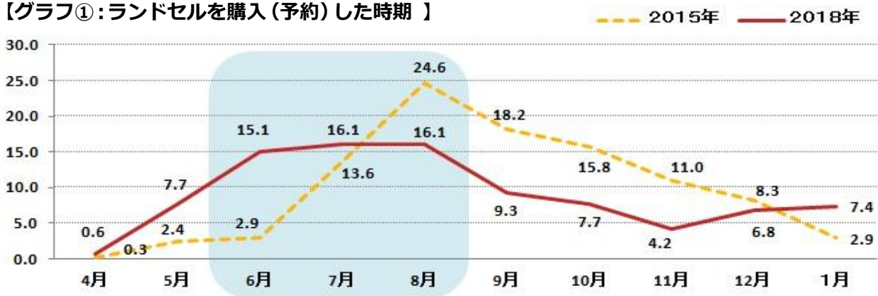
【グラフ①：ランドセルを購入(予約)した時期】

ランドセルの購入(予約)は、年長の5月が7.7%、6月が15.1%。2015年の調査では同月は2%台(グラフ①参照)だったことから動き出しが早まっているのが分かります。また、3年前は8月購入が24.6%と突出していましたが、今回は7月、8月ともに16.1%と 6～8月にかけて購入が分散化 しています。ママたちのクチコミで「早く買わないと欲しいランドセルが買えない」と広まり、8月までにランドセルを購入するのが定着してきているようです。