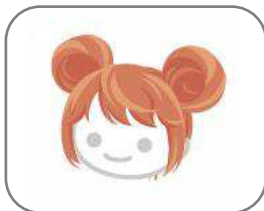
・ねずみさん風お団子ヘア(オレンジ)