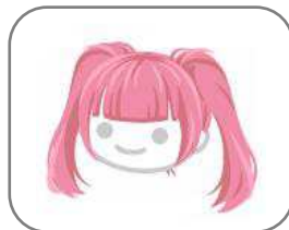
・ぱっつんちゅいんてーるヘア(ピンク)