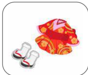
・@ほお〜むカフェの萌和服(赤)