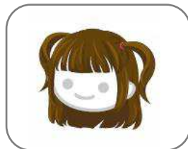
・ちょこっとちゅいんてーるヘア(ブラウン)