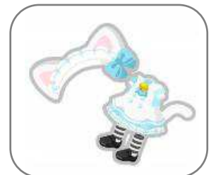
・@ほお〜むカフェの猫耳メイド服(ライトブルー)