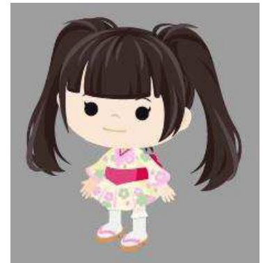
・@ほお〜むカフェの萌和服(白) ・ぱっつんちゅいんてーるヘア(黒)

※1 「なりきり通り」で販売するアイテムは、「なりきり通り」でのみ楽しむことができます。