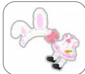
・@ほお〜むカフェのうさ耳メイド服(ピンク)