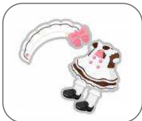
・@ほお〜むカフェのリボン付メイド服(黒)