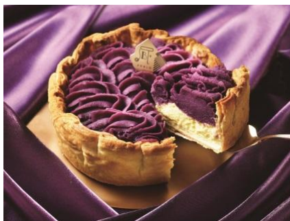
沖縄国際通り店限定 「紅芋チーズタルト」