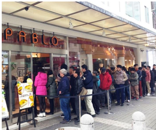
心齋橋店 行列の様子

赤城乳業株式会社(本社:埼玉県深谷市 社長:井上創太)は、焼きたてチーズタルト専門店 PABLO(パブロ)、株式会社ドロキア・オラシイタ(本社:大阪府大阪市 社長:嵯本将光)との共同開発で沖縄限定のチーズタルトをイメージした『PABLOアイス紅芋チーズタルト』を、4月19日(火)より全国のコンビニエンスストアで発売致します。