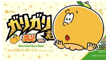
ナ～シナ～シ君～ 「みずみずしい～！」