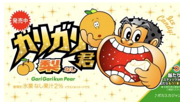
ガ～リガ～リ君～ 「つめた～い！」