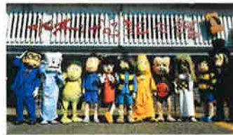
●鳥取県「ゲゲゲの鬼太郎と仲間たち」