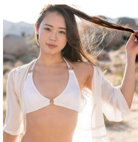
TSUKI ヨガライフスタイリスト