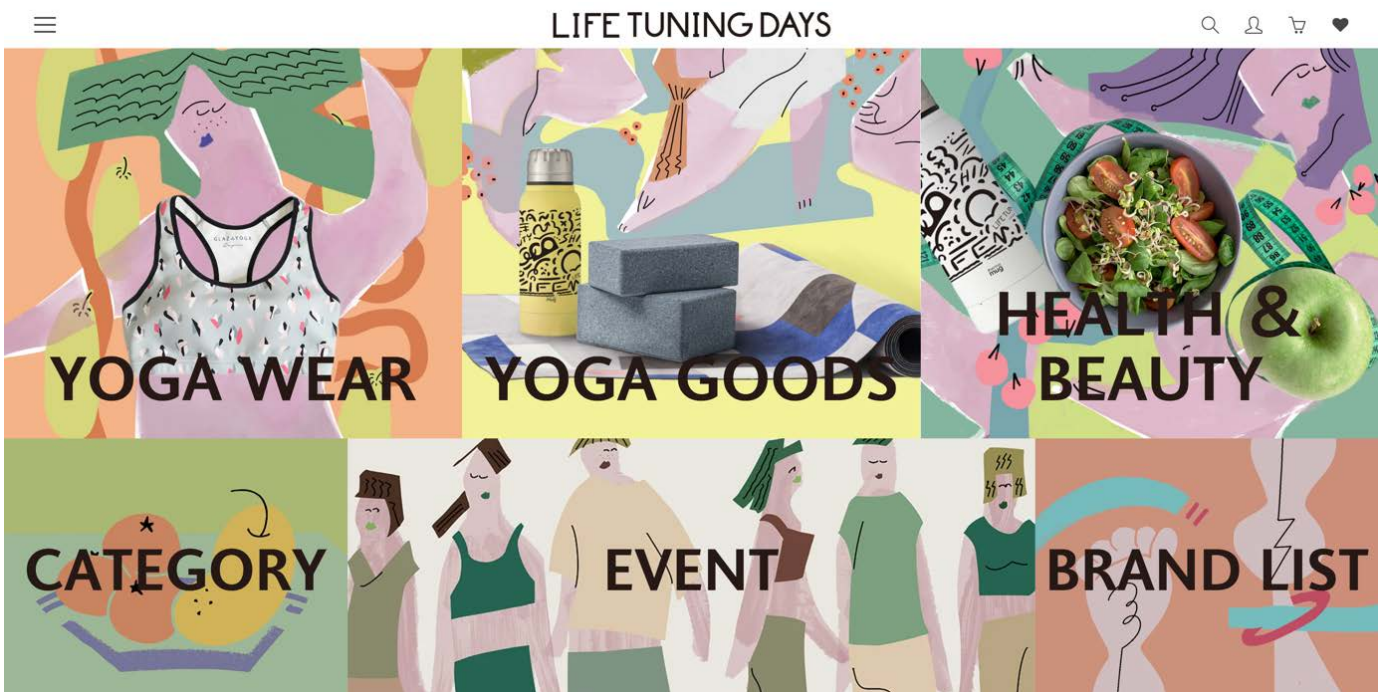
▲コミュニティECサイト「LIFE TUNING DAYS ONLINE」

また、同日の6月21日（日）国際ヨガデーに開催する1日限りの無料オンラインイベント「LIFE TUNING “THE DAY”」では、「LIFE TUNING DAYS ONLINE」と連携したショッピングリレーを実施します。新型コロナウイルスの感染拡大は、これまで大規模な展示会出展を行っていたヨガウェルネス市場にも大きな影響を与えています。「LIFE TUNING “THE DAY”」はそんな状況の中でアンバサダーや講師、一般参加者、出展企業、協賛企業がオンラインでひとつになり、1日を通して様々なウェルネスを体験。新しい生活様式をポジティブに生きるための心と身体を整えることをめざしています。