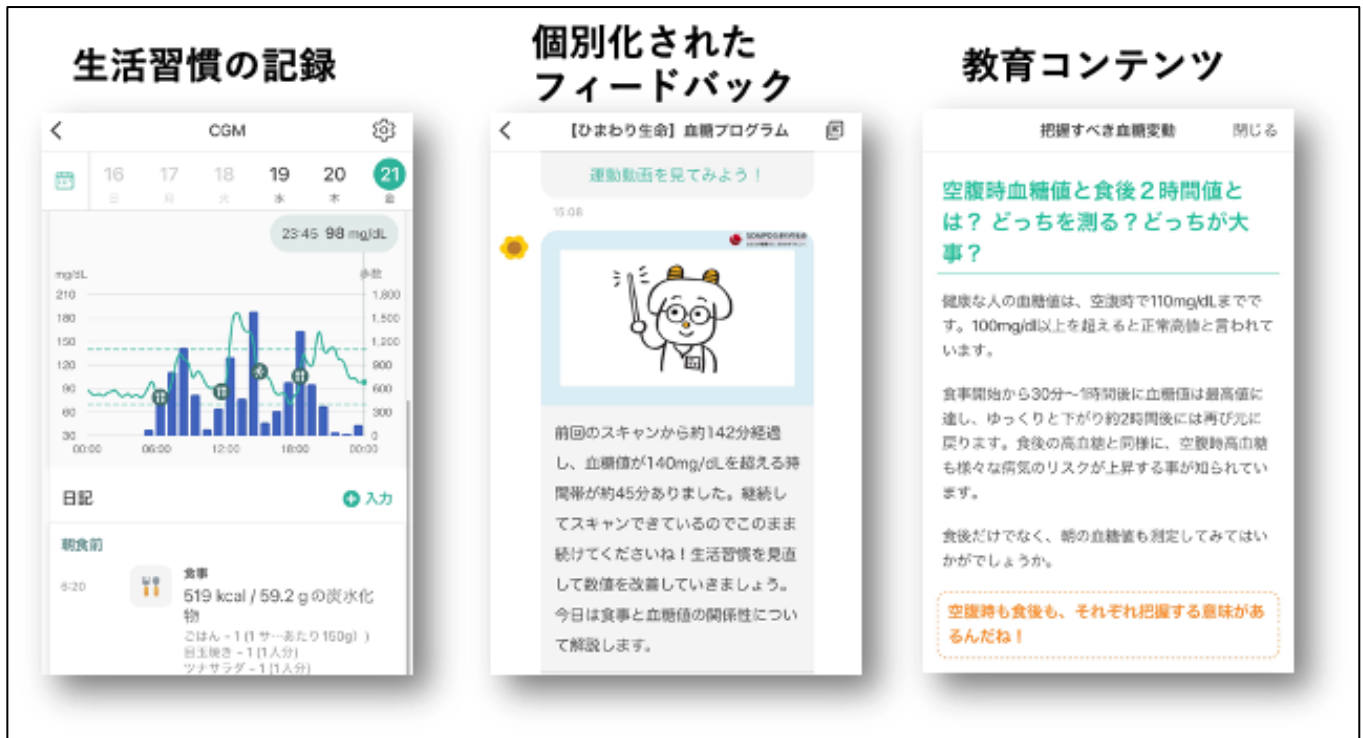
<図1 スマートフォンアプリの画面>

この2型糖尿病予防のためのスマートフォンアプリのプログラムの有効性を調べるために、3か月間のランダム化比較試験（注2）を行いました。本臨床試験には、糖尿病予備群（HbA1c 5.6%～6.4%、空腹時血糖値 110mg/dl～125mg/dl）で体重が多め（BMI 23Kg/m 2 以上）である179名が参加し、半数の方にのみこの新しい2型糖尿病予防・教育アプリを3か月間使用してもらい、使用しなかった残り半数の方と、血糖値、体重、食事摂取量、身体活動量などの改善度を比較しました。